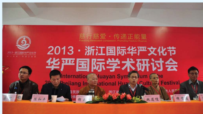
华严国际学术研讨会

GAZETTE OF THE PEOPLE'S GOVERNMENT OF LISHUI MUNICIPALITY