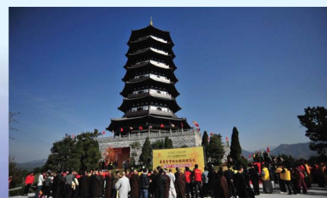
华严圣宝博物馆开馆仪式