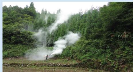
开展松褐天牛防治工作

GAZETTE OF THE PEOPLE'S GOVERNMENT OF LISHUI MUNICIPALITY