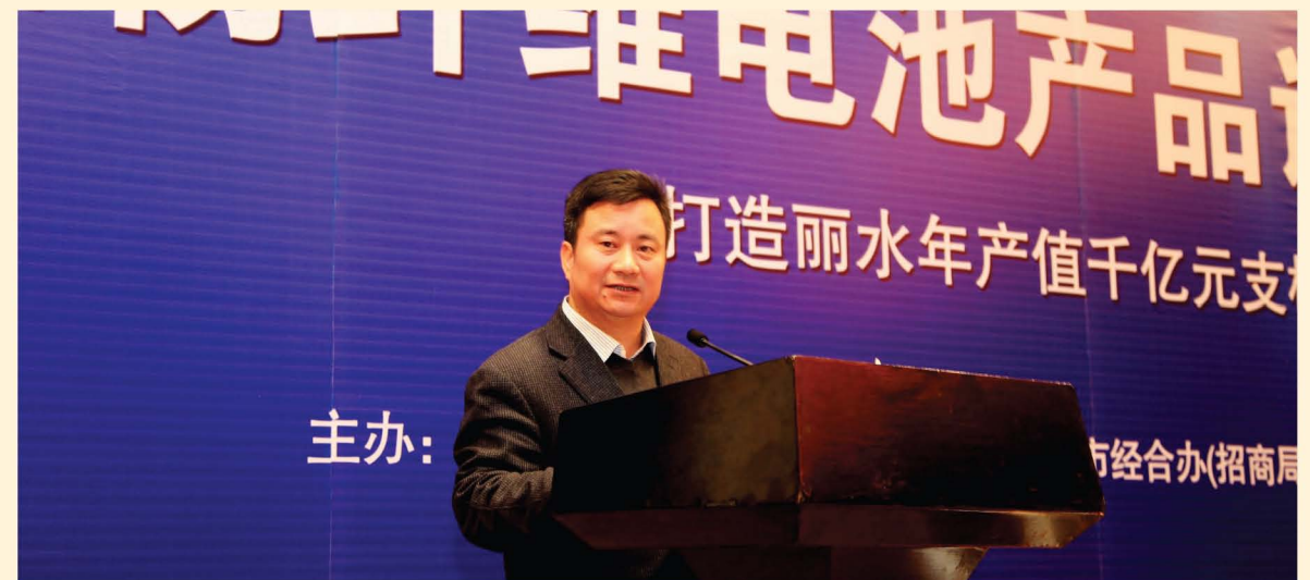
黄志平出席会议并讲话

会议最后强调,一分部署,九分落实。全市上下把思想统一到这次全会精神上来,把行动体现到全会的部署上来,进一步解放思想,狠抓落实,推进“双示范”,打造“绿富美”,为建设美丽幸福新丽水作出新的更大贡献。