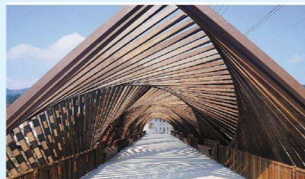
时光隧道——双螺旋石拱桥