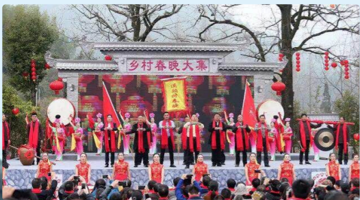
2018年乡村春晚在溪头村拉开序幕