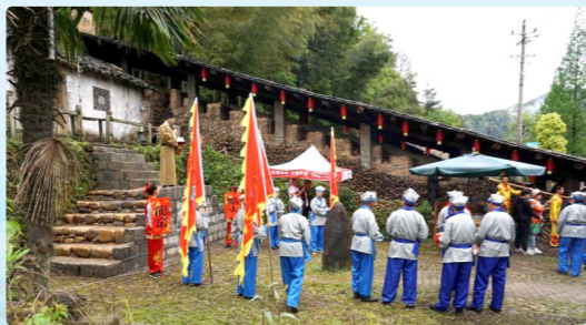
“不灭窑火”——传统龙窑烧制技艺活动